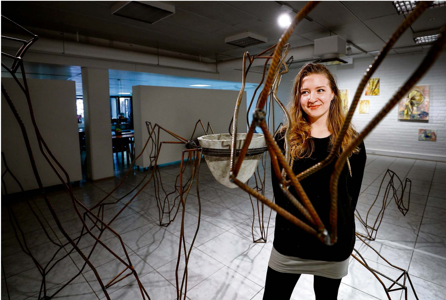
Tiia Heinosen kineettisessä veistoksessa vetoaa liikkeen ja materiaalin vuorovaikutus.

Ihmisen suhde teknologiaan askarruttaa muun muassa Ilka Wahalaa . Hänen 92 laukausta -installaationsa kaksi videota näyttää ampumaradalla harjoittelevan miehen. Laukausten mekaaninen toisto luo kalsean ja pakottavan, melkein väkivaltaisen meditatiivisen tilan. Toinen video on pelimäinen animaatio. Ajatus kulkeutuu hätkähdyttävään pieneen eron toden ja virtuaalisen välillä.